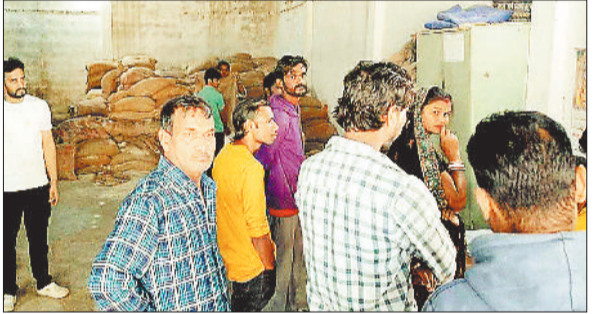
पीडीएस दुकान पहुंचे हितग्राही।

पर बैठे हुए हैं। वहीं दूसरी ओर पीडीएस के हितग्राहियों को खाद्यान्न का वितरण कर रहे हैं। इसे लेकर हड़ताल पर ही सवाल खड़े हो रहे हैं। जिले में सहकारी समिति कर्मचारी संघ की अनिश्चितकालीन हड़ताल के कारण जिले की समितियां किसानों के लिए काम नहीं कर रही है। वहीं दूसरी ओर हितग्राहियों के लिए उनके द्वारा काम