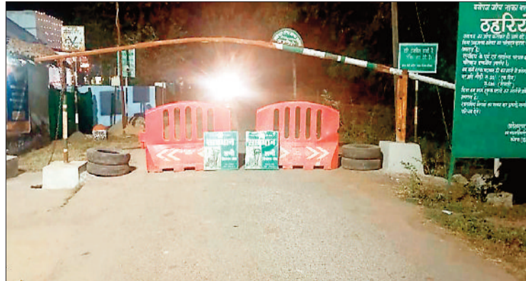
केसलपुर बैरियर को किया गया बंद।

कोरबा वनमण्डल के बालको वन परिक्षेत्र में 12 हाथियों के झुंड की मौजूदगी से ग्रामीणों में दहशत का माहौल बना हुआ है, वन विभाग हाथियों की निगरानी में जुटा हुआ है। कॉफी प्लांट मुख्य मार्ग के होकर पिकनिक मनाने जाने वाले लोगों को अस्थायी रूप से वापस