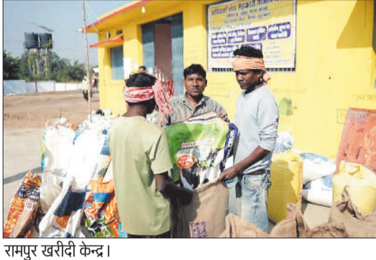
रामपुर खरीदी केंद्र।

हरिभूमि न्यूज ►► कोरबा धान खरीदी को शुरू हुए 4 दिन बीत चुके हैं इतने दिनों में केवल 7 केंद्रों में ही 396 किंवाटल धान खरीदा गया है। 11 किसानों ने धान बेचा है। शेष 58 उपार्जन केंद्रों को अभी भी बोहनी का इंतजार है। समिति कर्मियों के हड़ताल से काम पर नालोतने के