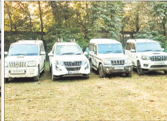
जब्त चार पहिया वाहन।