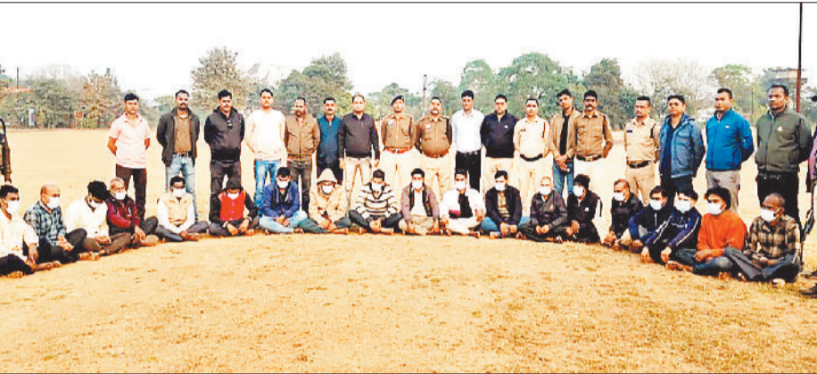
पुलिस गिरफ्त में आरोपी।

पड़ोसी ने ही डकैती की रची थी साजिश, आरोपियों से पिस्टल, हथियार, चार पहिया वाहन बरामद