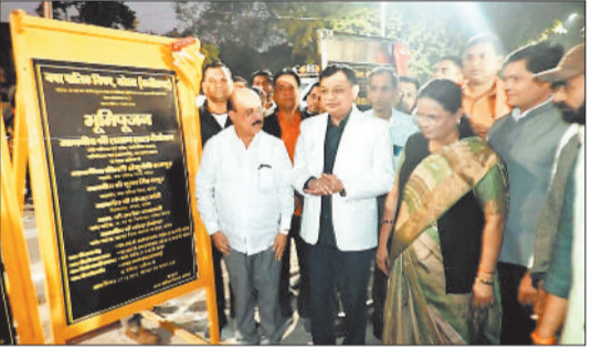
लोकार्पण करते हुए उद्योग मंत्री।