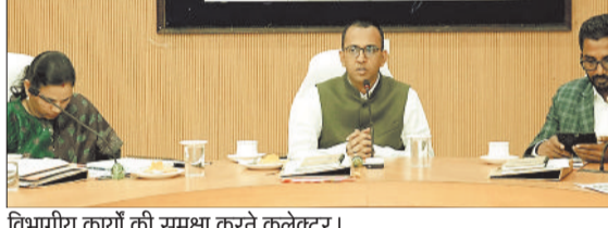
विभागीय कार्यों की समीक्षा करते कलेक्टर।

समय सीमा की बैठक में कलेक्टर ने की विभागीय कामकाज की समीक्षा