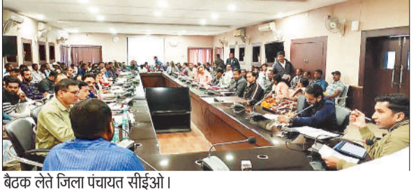
बैठक लेते जिला पंचायत सीईओ।